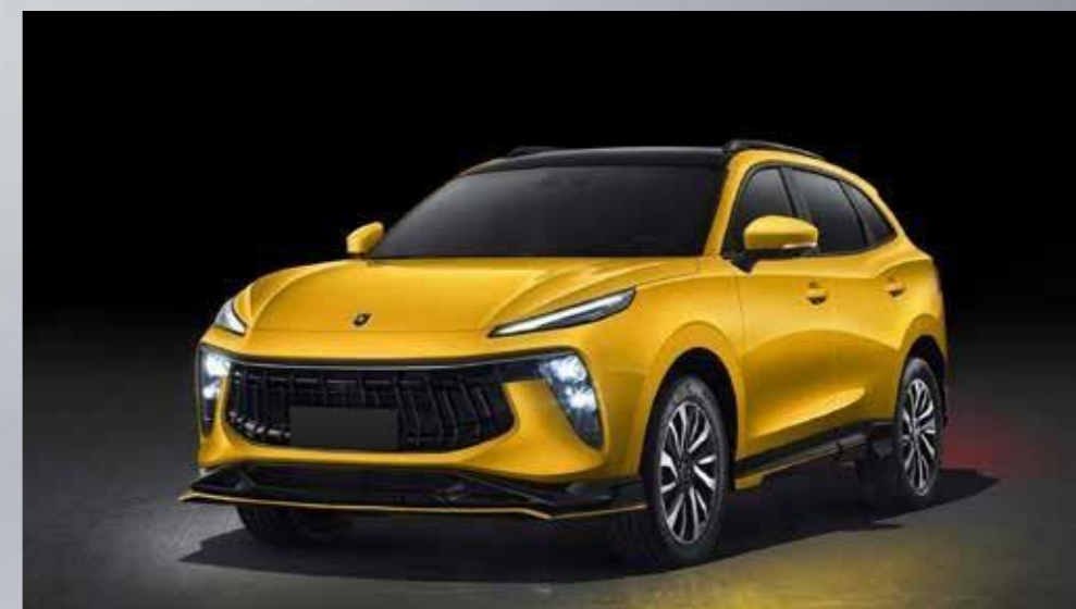
rumena (črna streha)*