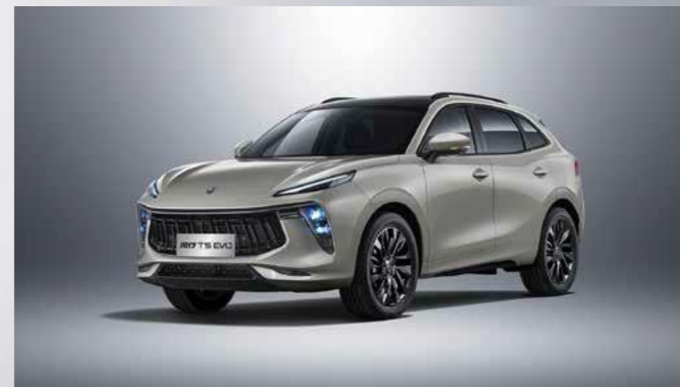
siva (črna streha)