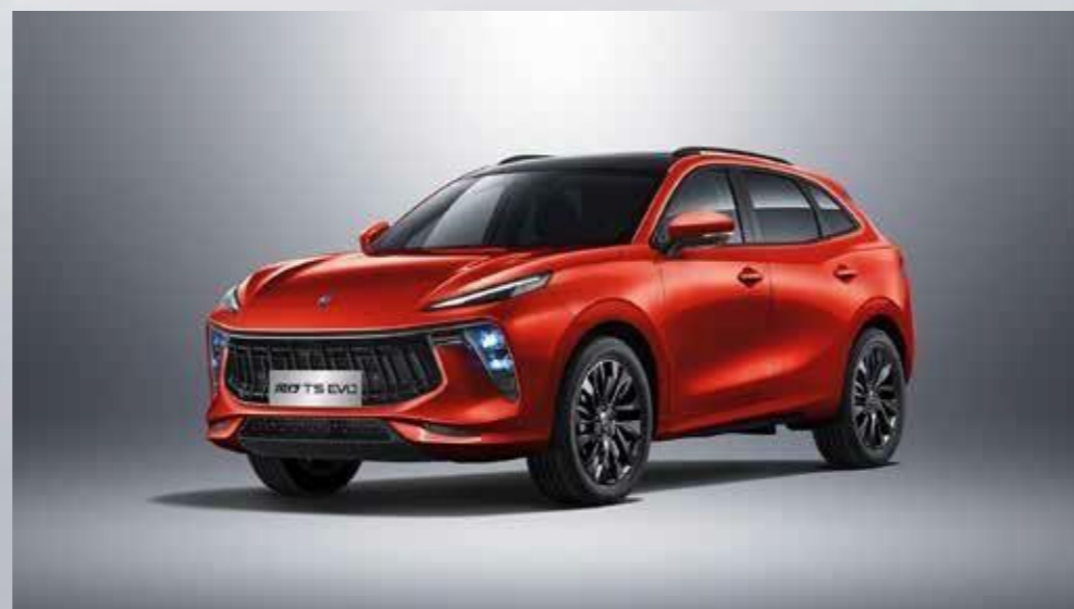
rdeča (črna streha)