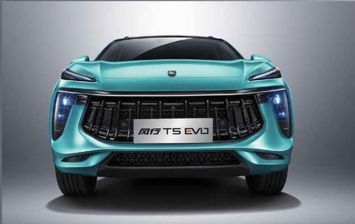
Športni sprednji del