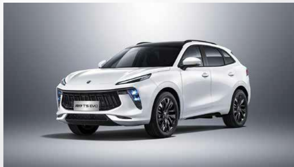
bela (črna streha)