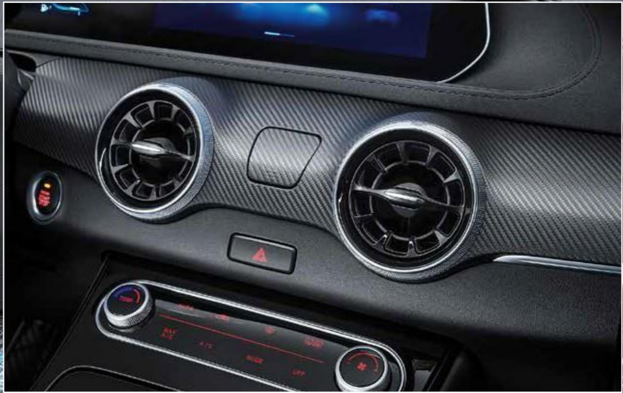
Karbonski vzorec s temnim zaključkom na armaturni plošči