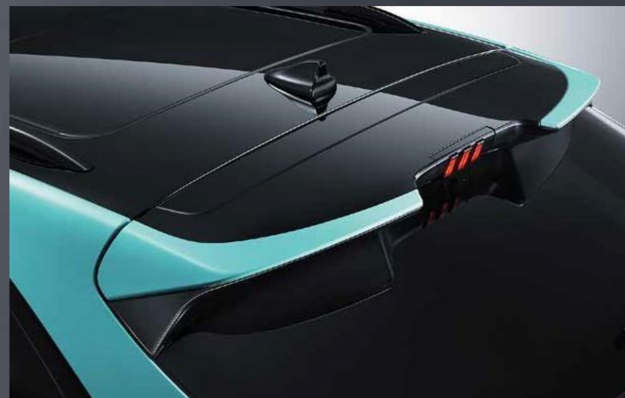
Strešni spojler v barvi karoserije