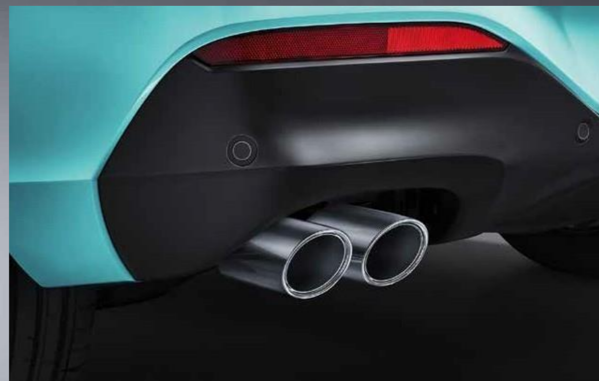
Športne izpušne cevi